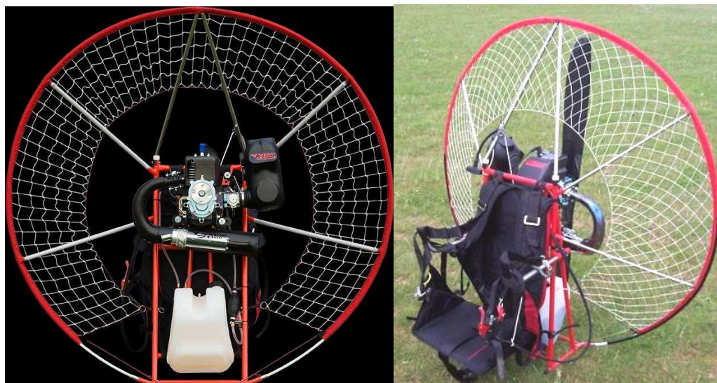
Mikalight cage fibre et châssis Inox (col de cygne fixes spéciales « grand gabarit » sur photo)